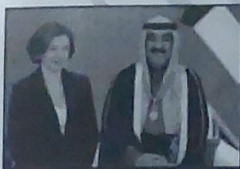
وسام قائد جوقة الشرف

( وسام قائد جوقة الشرف - وسام زايد - وسام الدولة - وسام آل سعيد )